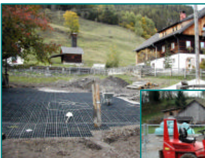
problemlos mit jedem