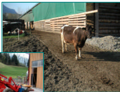
Traktor ect. zu befahren und zur Reinigung abzuschieben!