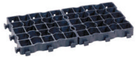
Plattenformat 33x33cm 3 cm hoch